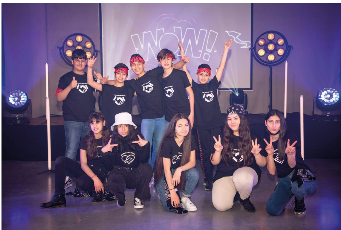
2022 fut notamment l'année de clôture des projets « Vivre enfant dans la migration », avec un colloque, le 21 octobre 2022. Ici, les jeunes réunis par l'ASBL ABC Cinéma pour la réalisation du film "Welcome chez vous".

L'année 2022 sera la première année complète du Fonds dans ses nouveaux locaux, au 123 de la Chaussée de Charleroi. L'accès continue à se faire par le 95, l'entrée de l'ONE.